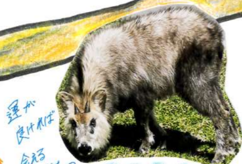
運が良ければ 会えるかも？ カモシカ。

② 蔵王体育館 蔵王温泉 103 4月～11月 無料、12～3月 有料 蔵王体育館から、高湯通りの 吉田屋旅館や高湯堂までの歩行者 用道路を通り、徒歩 3分